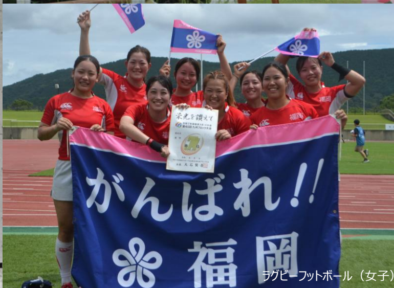
ラグビーフットボール（女子）