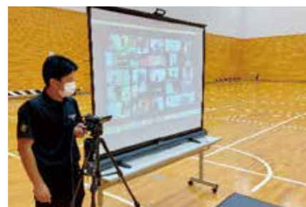
参加する受講生の映像