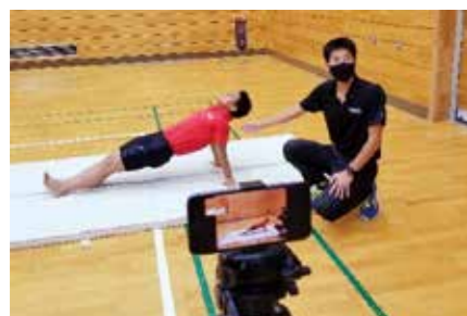
スタビリティートレーニング

様々な試行錯誤を経て実施していきましたが、「トレーニング方法やコンディショニングについて数多くの学びがあった」などの感想が受講生の日誌から確認できました。また、通常のプログラムとほぼ同数の受講生が参加していたことから、今後実施していく上での手応えを感じることができました。