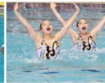
水泳 (アーティスティックスイミング)