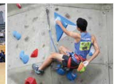
スポーツクライミング