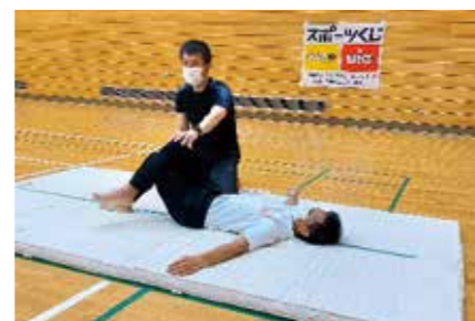
リカバリーについて

福岡県タレント発掘事業HPでもさまざまな情報を発信していますのでぜひご覧ください。 福岡県タレント発掘事業 検索