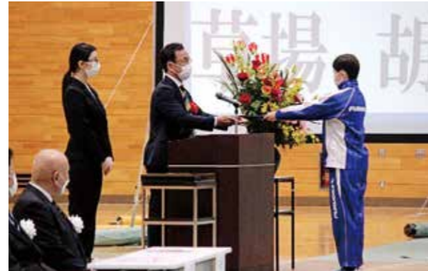
認定を受ける受講生