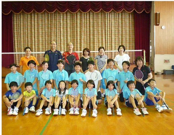
ここ2年間で団員も倍増し大変活気ある単位団です。育成母集団の「宇 美ドロップ」も結成され、指導者・リーダー・団員・保護者の連携が取 れて団の運営もスムーズに進むようになりました。