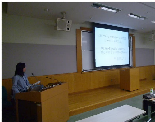
各ブロックのリー研の取り組みを熱く発表