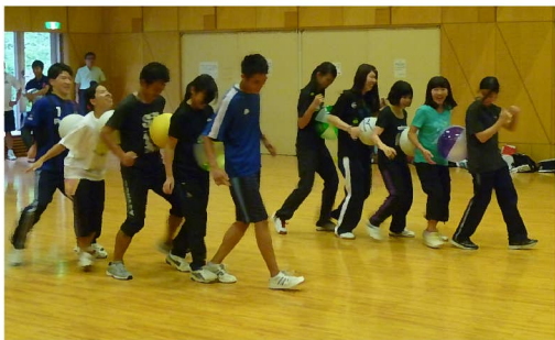
アクティブチャイルドプログラムの実技講習を 楽しく実習しました

九州ブロックリーダー 研究大会の前哨戦と して臨んだ全国連絡会 議のテーマは「リーダ ー会活動にアクティブ ・チャイルド・プログ ラムをどう活かすか」 でした。今回は4〜5 才の未就学児も楽しめ る内容で、幼児が入団 う計画です。