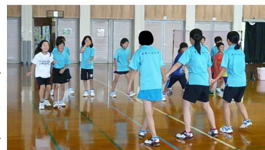
さかなとりというレクを楽しんでいます

県下でリーダー達が活発に活動している単 位団を紹介するコーナーです。糟屋郡宇美町 の「宇美町初心者バドミントンクラブ」は、 スボ少に加盟してまだ二年目の単位団です が、町や県のジュニアリーダースクール、県 のリーダー研修会に積極的に団員を派遣し、 スクーリングで学んだことを単位団の活動に積 極的に取り入れています。現在男女合わせて7 人のリーダーが活発に活動し、笑顔が絶えな いクラブになりました。リーダー達の活動を間 近で見ている五年生団員も、早くリーダーに なりたくて、うずうずしているそうです。